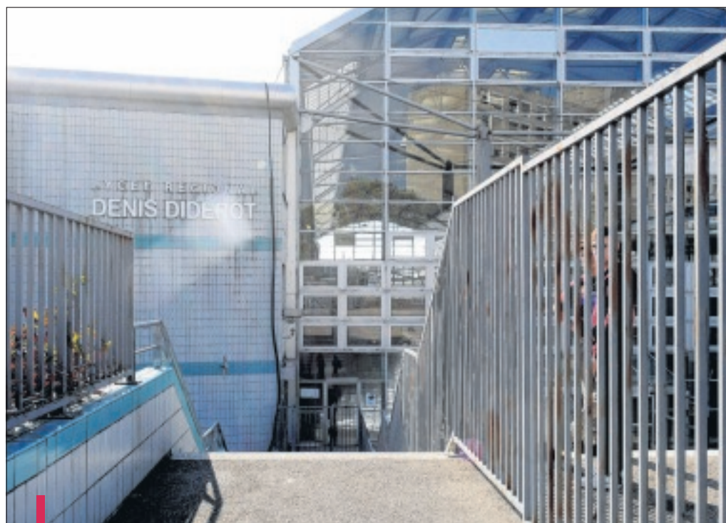
Dans ce lycée qui accueille des sections générales, technologiques et professionnelles, les résultats sont depuis trois ans en constante progression.